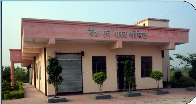
बैंक एवं पोस्ट ऑफिस