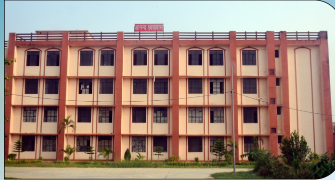
आनन्द पुरुष छात्रवास