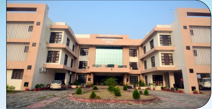
तथागत अन्तरराष्ट्रीय केन्द्र (अतिथि गृह)