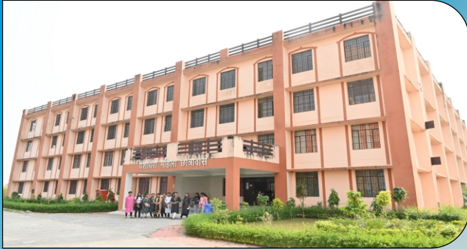
यशोधरा महिला छात्रवास