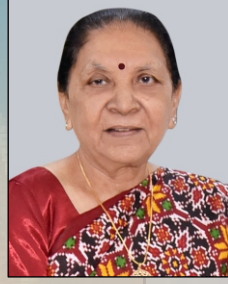
माननीया श्रीमती आनंदीबेन पटेल कुलाधिपति सम्प्रति श्री राज्यपाल उत्तर प्रदेश